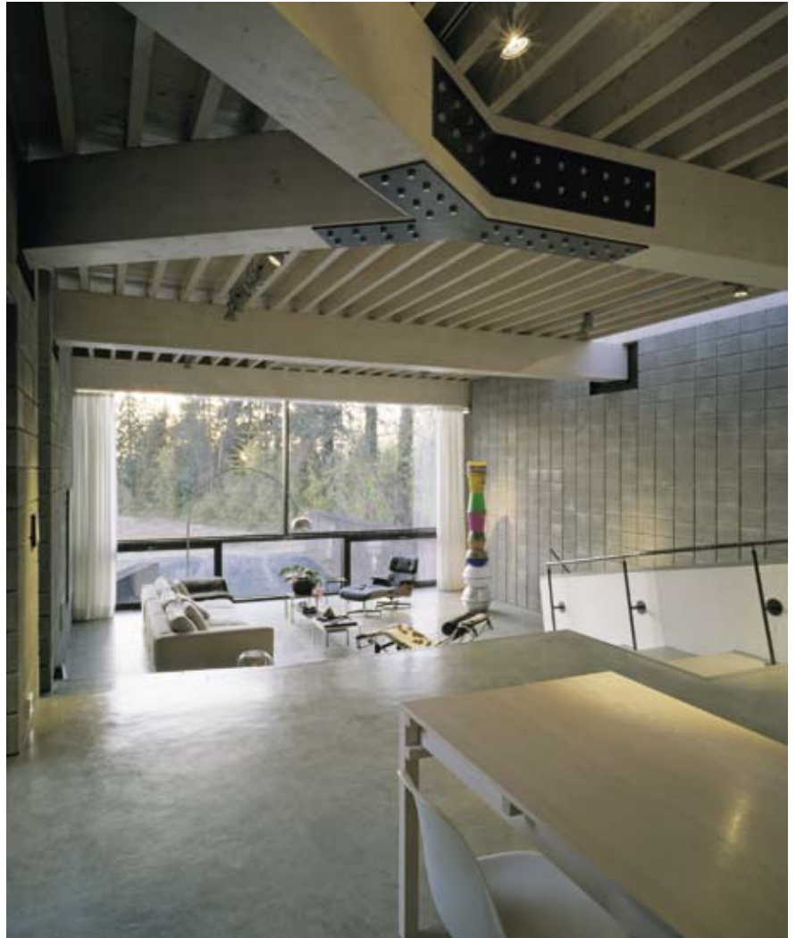
Het interieur van het hoofdvertrek kent verschillende niveaus. De woonruimte ligt onderaan. De materialen en de verbindingen zijn in het zicht gelaten en geaccentueerd.

Aanvang bouw juni 2005 / Oplevering augustus 2006