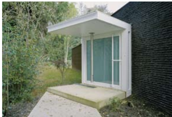
De entree onderstreept het informele karakter van de woning.