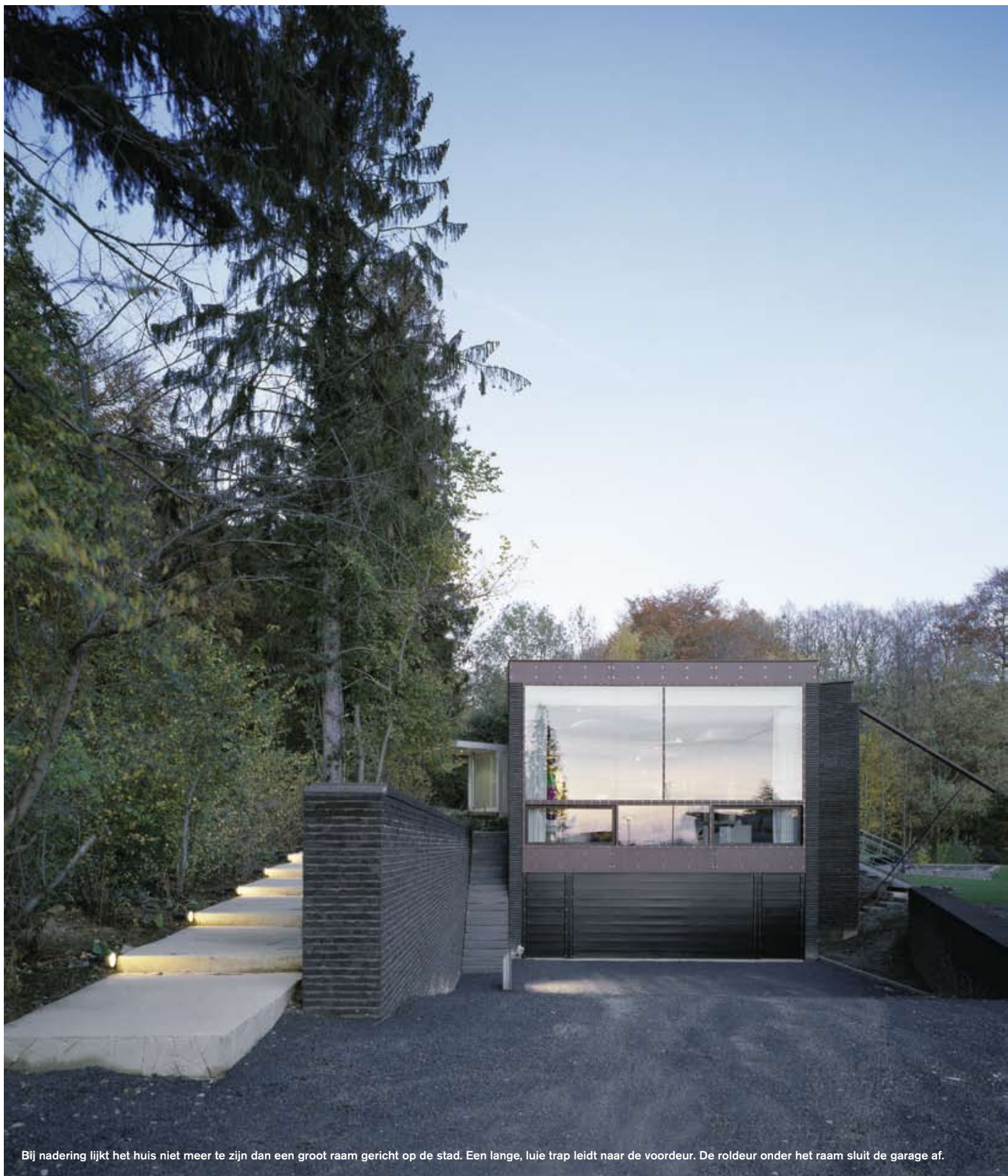
Bij nadering lijkt het huis niet meer te zijn dan een groot raam gericht op de stad. Een lange, luie trap leidt naar de voordeur. De roldeur onder het raam sluit de garage af.