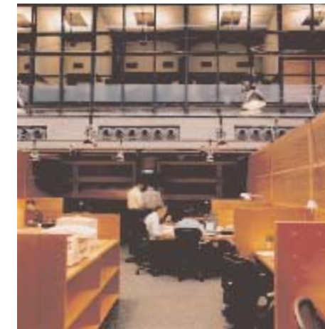
ACCELERATOR MCKINSEY, AMSTERDAM Opdrachtgever McKinsey & Company Ontwerp Bruls & Co Advies kantoorconcept Veldhoen & Company Akoestiek Adviesbureau Peutz & Associates BV Interieurbouw Soons Interieurbouw BV Omvang 1000 m 2 Ontwerp 2000 Uitvoering 2000