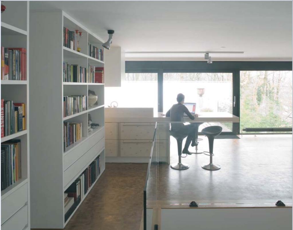
Glas speelt in in- en exterieur een belangrijke rol.