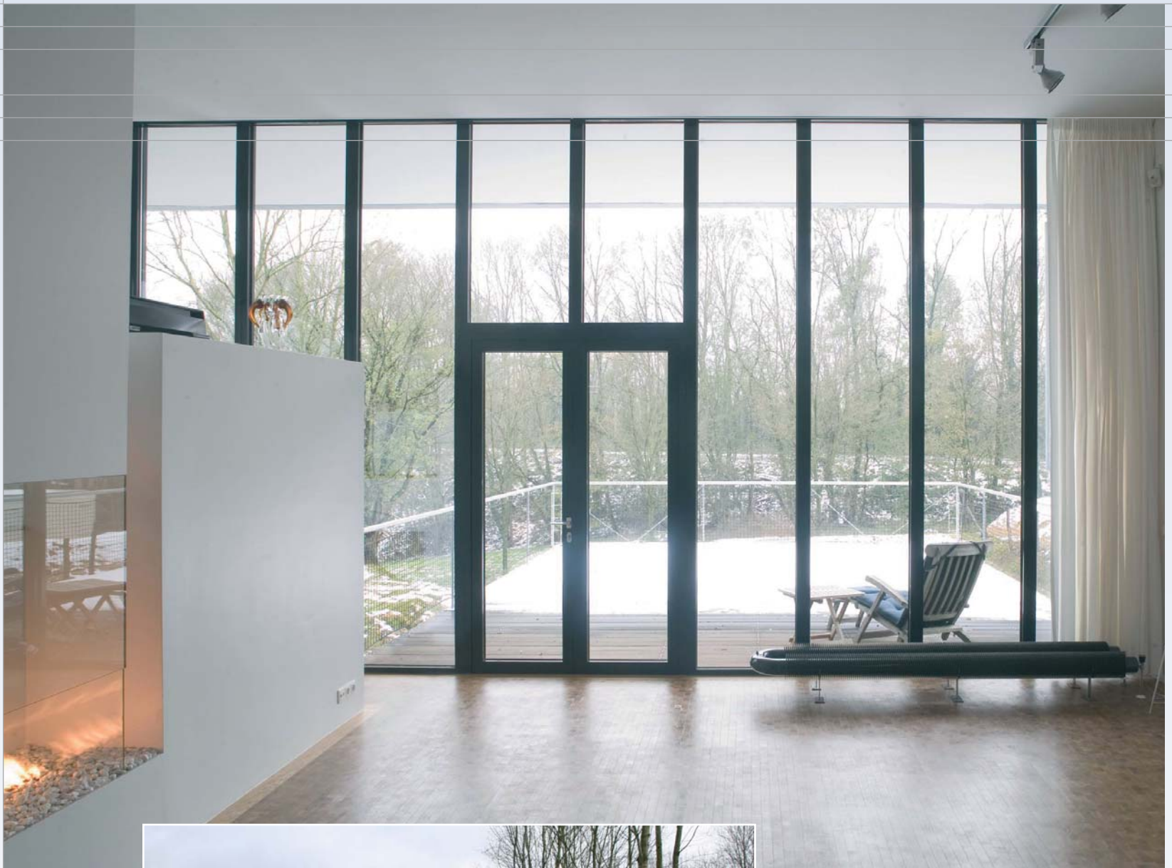
Gevelpui met uitzicht op de omgeving.