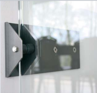
Detail van de balustrade.