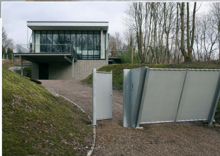
De straatgevel van de villa.