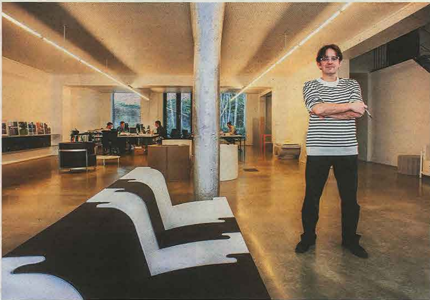
"Als je bij elkaar zit, ontstaat automatisch een betere samenwerking."