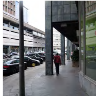
Rue des Croisiers