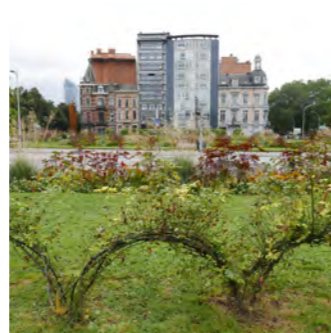
Avenue des Croix du Feu