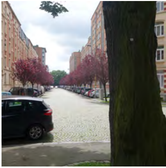
Avenue Reine Elisabeth