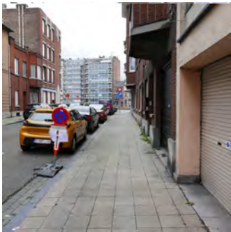
Place Sylvain Dupuis